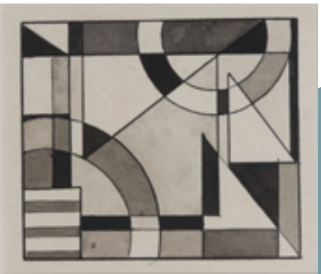
Félix De Boeck. Composition . 1920

L'œuvre que nous présentons est l'une de ses premières œuvres abstraites, au sein d'un mouvement en pleine formation. L'ordonnement complexe de formes géométriques est un bel exemple de cet idéal constructiviste prôné par les groupes d'avant-garde. On y décèle les lignes et les cercles tranchés qui seront caractéristiques de la patte de l'artiste.