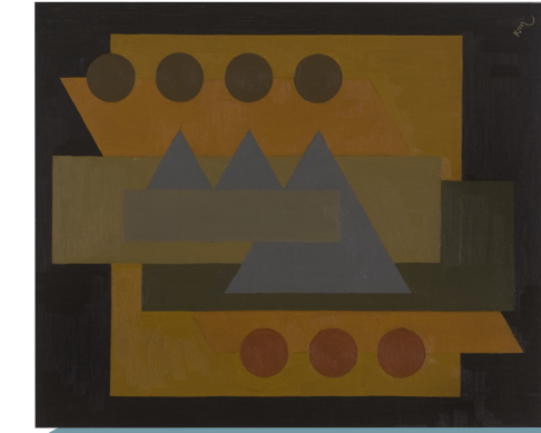
Karel Maes, Compositie , 1923

Hij wordt beschouwd als een van de Belgische pioniers van de geometrische abstractie. Tijdens zijn artistieke opleiding, volgde hij een korte periode les aan de Academie voor Schone Kunsten te Brussel waar hij bevriend werd met Flouquet en Magritte. Na