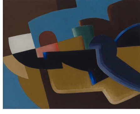
Edmond Vandercammen, Compositie , années 1920

Het doek in onze collectie, Composition , dateert uit de jaren twintig en is een mooi voorbeeld van Vandercammens aantrekkings tot het kubisme. In de krommingen van de lijnvoering en het kleurgebruik kunnen we ook sporen van