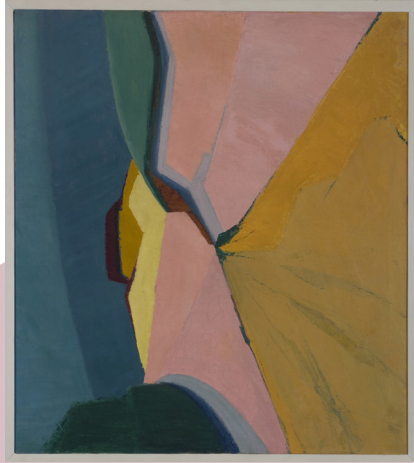
Jan Kiemeneij, Na het ontzeder in de duinen , 1921

Na de oorlog werkte hij in een post-impressionistische stijl met fauvistische toets. Landschappen waren een geliefkoosd onderwerp. In 1921 werd Kiemeneij lid van de Kring Moderne Kunst van Jozef Peeters. Tijdens de tentoonstelling naar aanleiding van het tweede congres van Moderne Kunst (zaal El Bardo, 1922) toonde hij 5 schilderijen, tekeningen en moderne toneeldecors met geometrische vormen en gebogen lijnen die aanleunen bij de art