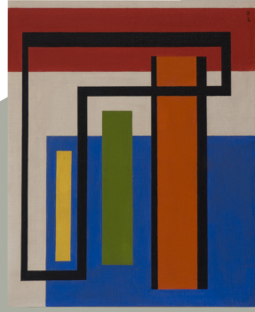
Guy Vandenbranden, Compositie , 1956

Vandenbranden werd geboren in Brussel en studeerde in het vrije atelier L'effort. Het is via de groep La Jeune Peinture Belge dat hij de abstractie leerde kennen en zo, vanaf 1952, zelf abstracte composities begon te creëren. Na eerst eerst even kort in de lyrische stijl te hebben gewerkt, zou hij zich al snel toeleggen op de geometrische abstractie, een stijl die hij heel zijn leven trouw zou blijven. De kunstenaar onderhield vele, zowel nationale als internationale, vriendschappelijke relaties en nam deel aan aan talrijke artistieke bewegingen zoals Art Abstrait , Formes , Art Construit . Na 1960, tijdens zijn aansluiting bij de groep De Nieuwe Vlaamse