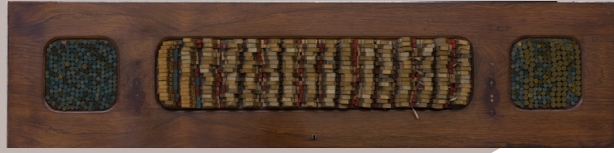
Vic Gentils, Composition , 1963

Zwart-Wit heeft een modernistische architecturale kwaliteit dat geëvoceerd wordt door het gebruik van rechte lijnen, het achterwege laten van het ornament , de materiaalkeuze (plaaaster en metaal) en het sculpturale karakter van het werk.