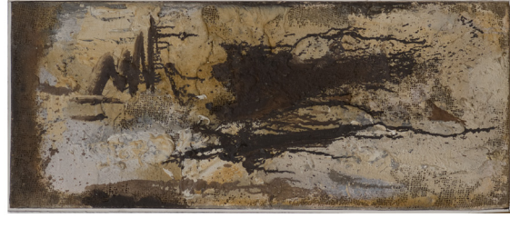
Bram Bogart, Gehoorzaamheid , 1957

Hoewel Gehoorzaamheid nog geen schilderij is dat gedomineerd wordt door de materie getuigt het van een experimenteel proces. Hij vermengt een dikke materiaellaag met een meer vloeibare laag, waardoor er klodders ontstaan, terwijl hij hier en daar het doek onbeschilderd laat.