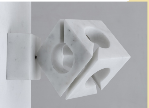
Jan Dries, Inzicht , 1984

In de collectie van het museum is het werk Inzicht opgenomen. Een schijnbare kubus met niet-volledige cirkels die op een van de hoeken balanceert op een rechthoekige marmeren sokkel. Door deze positie wordt de blik doorheen het marmer verstoord en ervaart de toeschouwer als het ware het innerlijke van het marmer, waardoor hij zowel letterlijk als figuurlijk inzicht in het werk verkrijgt.